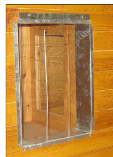
Dør i klar polyetylen fås som tilbehør

Luksus-hundehuset leveres atskilt for enkel transport og håndtering. Samles på få minutter – skruer og bruksanvisning medfølger.