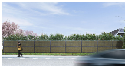
Antrasitt RAL 7016