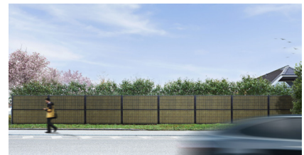
Svart RAL 9005