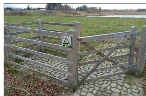
Her er grinden i «posisjon 2». I denne posisjonen holdes grinden fast med én enkelt grindlås.