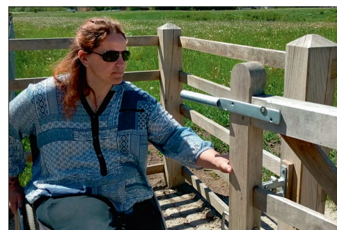
Grinden åpnes fra «posisjon 1» til «posisjon 2». Grinden er selvlukkende så den aldri kan stå halvt åpen.

Dyrene kan under ingen omstendigheter slippe ut gjennom HandyGaten. Grinden er hengslet så den sitter lite grunn skrått, og denne vinklingen gjør at grinden automatisk «lukker seg». Det er derfor umulig å la grinden stå halvt åpen – og uansett om den står i «posisjon 1» eller «posisjon 2» er HandyGaten alltid stengt for dyrene.